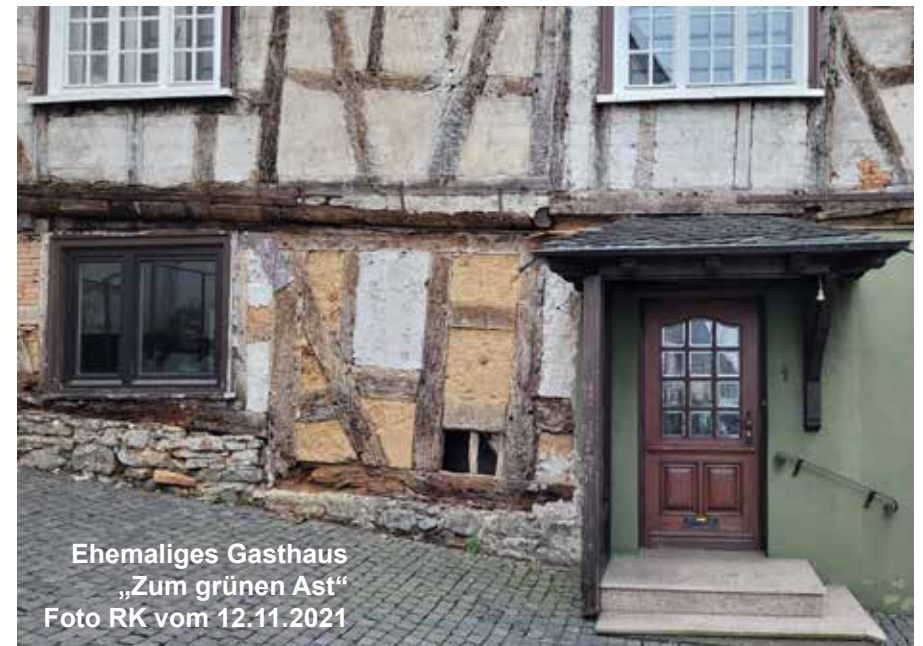
Ehemaliges Gasthaus „Zum grünen Ast“

Das Haus in der Friedrichstraße wurde 2020 von den Erben an die evangelische Kirche verkauft. Damit ist die Geschichte des Gasthauses „Zum grünen Ast“ endgültig beendet. Die eingeleitete Restaurierung des Hauses zeigt, dass es ein altes Fachwerkhaus ist. /BS