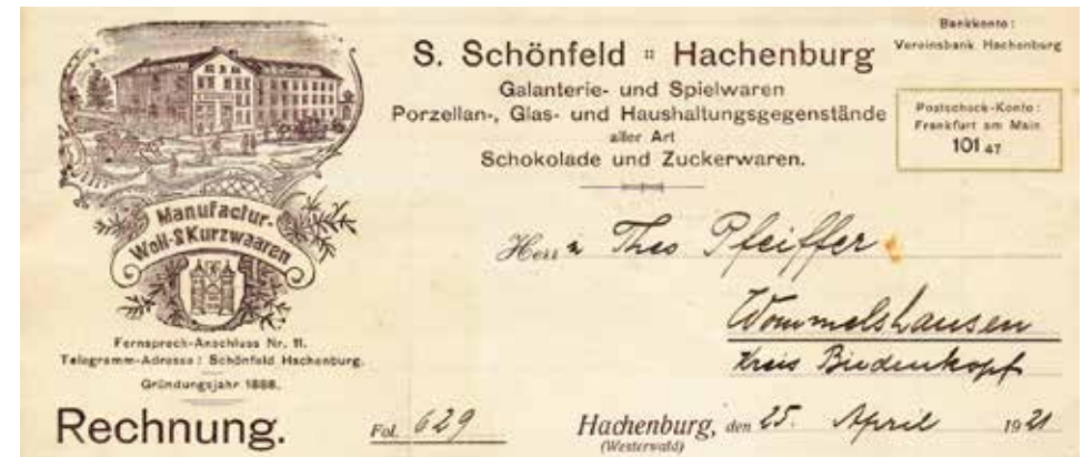
Briefkopf einer Rechnung der Firma „Simon Schönfeld“ von 1921

soires. Zu den Galanteriewaren zählen Modeschmuck und kleinere modische Gebrauchsgegenstände wie Parfümfläschchen, Puderdosen, Armbänder, Tücher, Schals, Fächer usw.. Aus einer Anzeige von 1901 geht hervor, dass es auch „Specialitäten für Hausirer, Markt- und Mess-Besucher“ gab.