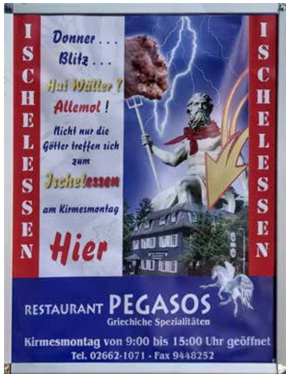
Ischelessen am Kirmesmontag im Pegasos