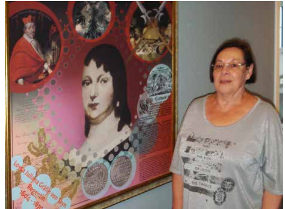
Porträtbilder für die Flure und Ansichtskartenbilder für die Hotelzimmer - geliefert von der GWH