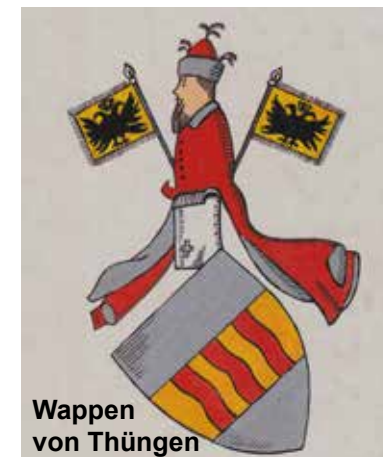
Wappen von Thüngen