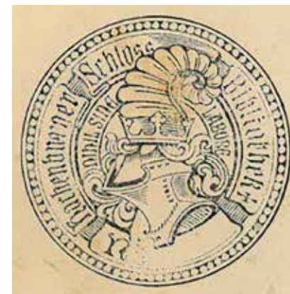
Stempel in „Armée Mexicaine“

Publikation von H. Sayn von 1886 mit dem Wappen von Graf Alexander