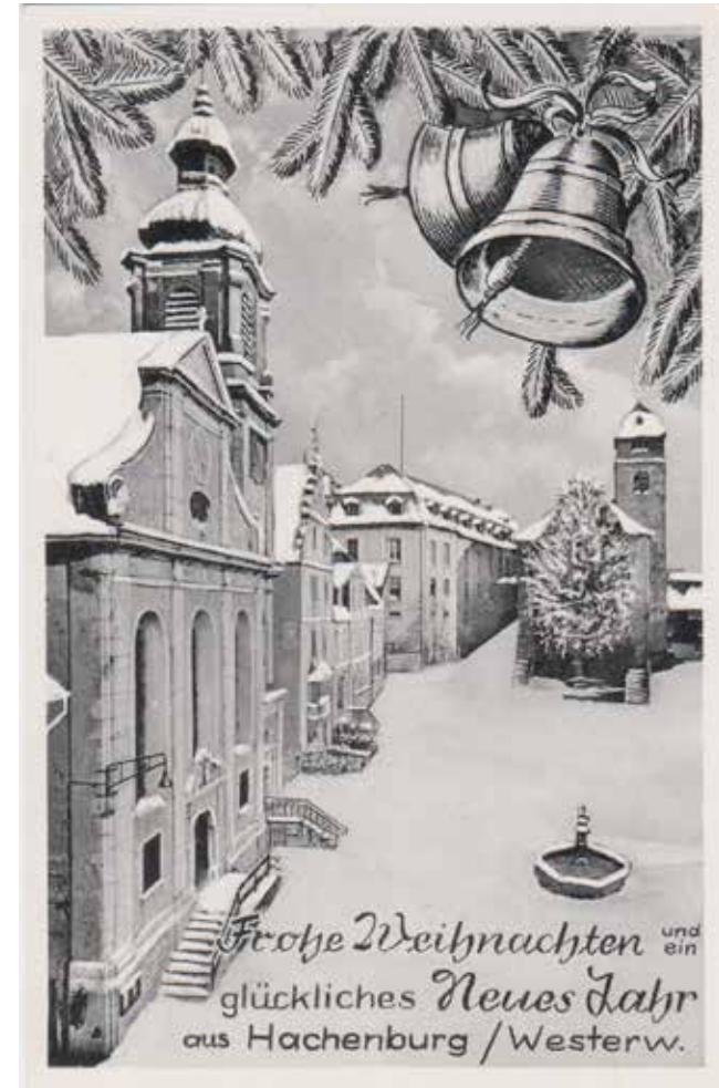
Weihnachtskarte von Buchhandlung Paul Spingler 1953

Ort: REWE-Markt Hbg., Koblenzerstr. 38 Termin: 6. Dezember 2018, 9.30 Uhr Thema: Brauchtum rund um den Nikolaus