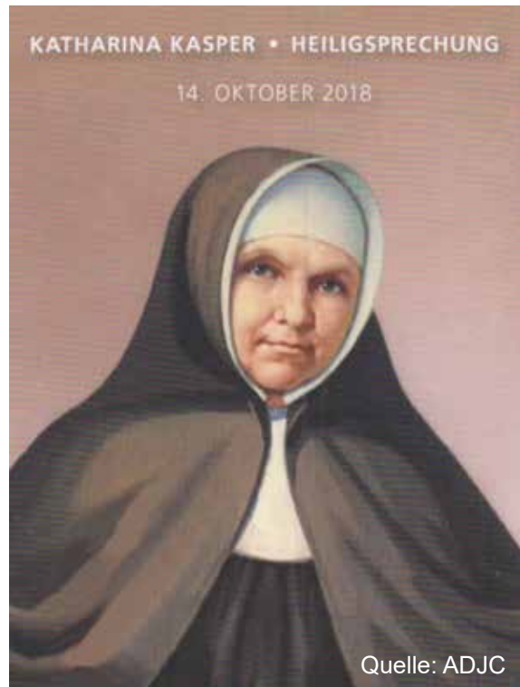
Katharina Kasper, Gründerin der Kongregation der Armen Dienstmägde Jesu Christi (Dernbacher Schwestern)