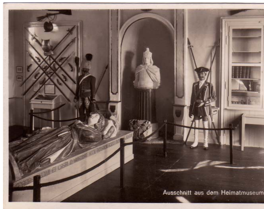
Ausschnitt aus dem Heimatmuseum

Wir sind bestrebt, das Heimatmuseum zu einem Anziehungspunkt der Stadt zu machen. Der Fremde, der es im nächsten Jahre besucht, soll angenehm überrascht sein und er nicht allein. Berechtigter Lokalstolz nennt den Alten Markt „die gute Stube“, möge er berechtigt werden, das Heimatmuseum als „die Visitenkarte“ Hachenburgs zu bezeichnen. L. Glaser