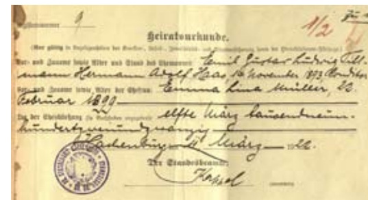
Geburts- und Heiratsurkunde Adolf Haas

Der § 4 Abs.1 des Verschollenheitsgesetzes, auf den im Antrag Bezug genommen wird, lautet: „(1) Wer als Angehöriger einer bewaffneten Macht an einem Krieg oder einem kriegsähnlichen Unternehmen teilgenommen hat, während dieser Zeit im Gefahrgebiet vermißt worden und seitdem verschollen ist, kann für tot erklärt werden, wenn seit dem Ende des Jahres, in dem der Friede geschlossen oder der Krieg oder das kriegsähnliche Unternehmen ohne Friedensschluß tatsächlich beendet ist, ein Jahr verstrichen ist.“