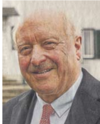
Konrad Adenauer Enkel des Bundeskanzlers

In der GWH-Publikation werden auch über 90 Objekte der sog. „Schützengrabenkunst“ dargestellt. Die diesbezügliche Sammlung von Bruno M. Struif wird bis Mitte Juli im Landschaftsmuseum Westerwald gezeigt. Die Artefakte aus dem Schützengraben stoßen bei vielen Besuchern auf großes Interesse, wie man den Eintragungen aus dem Gästebuch entnehmen kann. Viele nehmen weite Anfahrtswege in Kauf, um diese Ausstellung zu sehen. Bereits am 11. April 2017 fand das Nähkästchen „Osterbräuche“ im Kleinen Museum im Nistertal statt. Eine weitere Nähkästchen-Veranstaltung wurde am 21. Juni 2017 im Kontext der Ausstellung „Schützengrabenkunst“ durchgeführt. Thema war die „Gefallenen-Erinnerungskultur“.